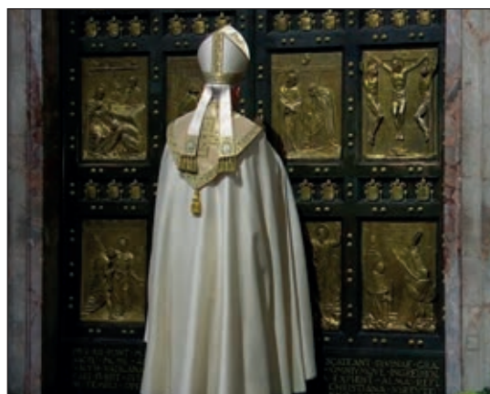
León XIV cerrando la Puerta Santa

Sorprende el hecho de que sea precisamente Jerusalén, la ciudad testigo de tantos nuevos comienzos, la que esté turbada. En su seno, el que estudia las Escrituras y piensa que tiene todas las respuestas parece haber perdido la capacidad de hacerse preguntas y de cultivar deseos. Es más, la ciudad está atemorizada por el que, movido por la esperanza, llega a ella desde lejos, hasta el punto de considerar como amenaza aquello que debería, por el contrario, causarle mucha alegría. Esta reacción