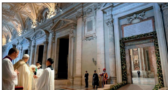
Ceremonia de clausura de la Puerta Santa

Los magos traen a Jerusalén una pregunta sencilla y esencial: «¿Dónde está el rey de los judíos que acaba de nacer?» (Mt 2,2). Qué importante es que, el que cruza la puerta de la Iglesia, se percate de que el Mesías recién ha nacido allí, que allí se reúne una comunidad donde ha surgido la esperanza, que allí se está realizando una historia de vida. El Jubileo ha venido a recordarnos que se