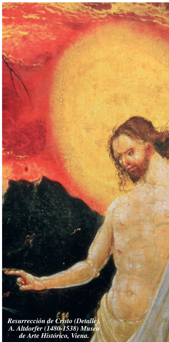
Resurrección de Cristo (Detalle). A. Altörfer (1480-1538) Museo de Arte Histórico, Viena.