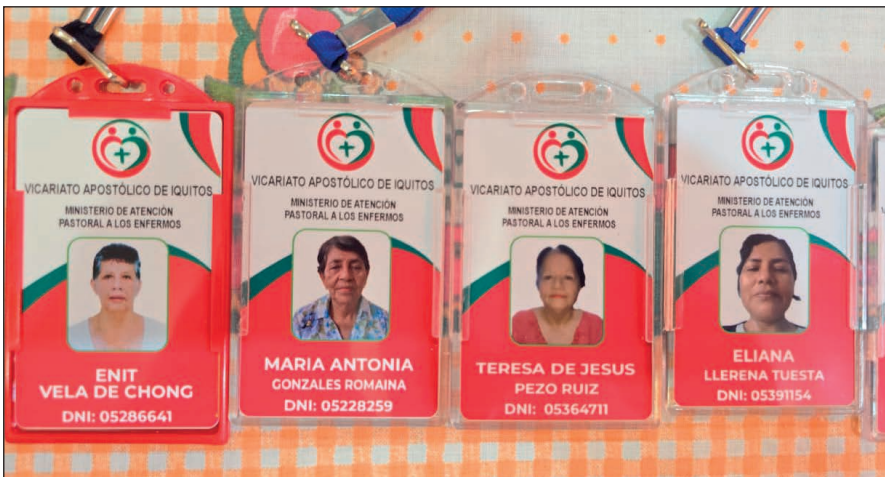
Tarjetas de identificación de los ministros de atención a los enfermos

con los ojos llenos de lágrimas y nos dijo: “Pensé que nadie se acordaba de mí...” Fue un momento sagrado. Le hablamos brevemente sobre la ternura de Dios, que no abandona a sus hijos, y sobre cómo el Señor se hace presente a través de los pequeños gestos de amor. Antes de retirarnos, nos pidió que volviéramos. Nos tomó de la mano con fuerza, agradeciendo por la oración. Aquella experiencia nos recordó que la pastoral de la salud no es solo un servicio, sino una misión en la que Dios se manifiesta con fuerza. Experiencias como estas me fortalecen para continuar sirviendo en este ministerio y animo a otros a hacer lo mismo”.