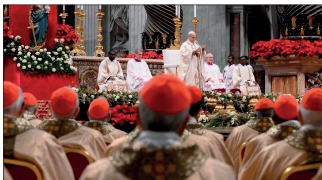
Eucaristía en San Pedro en la Clausura del Año Santo