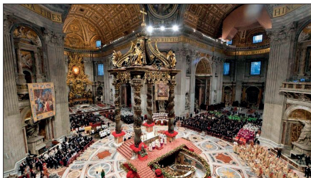
Basilica de San Pedro en la Clausura del Año Santo

Es la Epifanía de la gratuidad. No nos espera en los lugares prestigiosos, sino en las realidades humildes. «Y tú, Belén, tierra de Judá, ciertamente no eres la menor entre las principales ciudades de Judá» (Mt 2,6). Cuántas ciudades, cuántas comunidades necesitan que se les diga: “Ciertamente no eres la menor”. Sí, ¡el Señor nos sigue sorprendiendo! Se deja encontrar. Sus caminos no son nuestros caminos, y los violentos no consiguen dominarlos, ni los