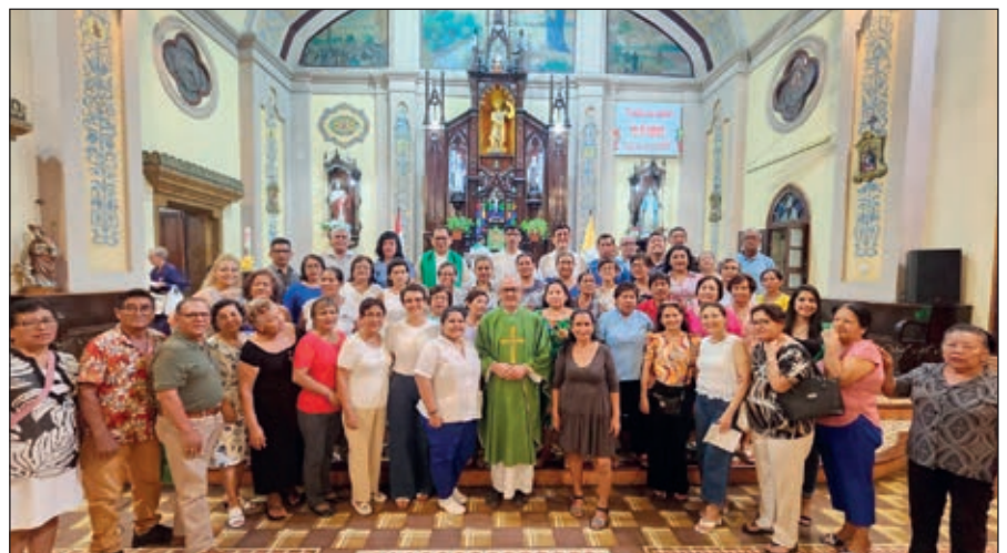
Los ministros de la pastoral de atención a los enfermos luego de la misa de envío con Mons. Miguel Angel Cadenas.