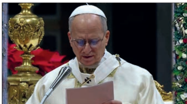
Homilía de León XIV en la Clausura del Año Santo