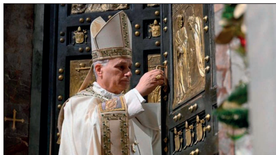
León XIV cerrando la Puerta Santa

Preguntémonos: ¿hay vida en nuestra Iglesia? ¿Hay espacio para aquello que nace? ¿Ama-