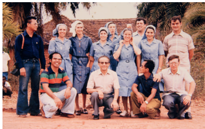
Agustinos y Agustinas en Mahanje en 1980

En febrero de 1979 llegaron las 3 primeras hermanas Agustinas Misioneras a Mahanje para hacerse cargo del hospital y otras ayudas asistenciales al pueblo. Entre muchas actividades de ayuda asis-