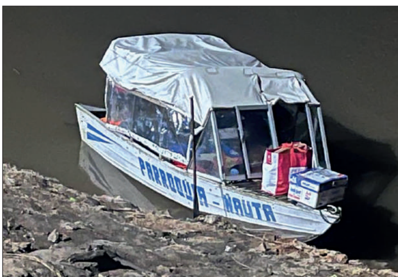
Embarcación de la misión de Nauta, Iquitos, Perú

años desde la última presencia del sacerdote.