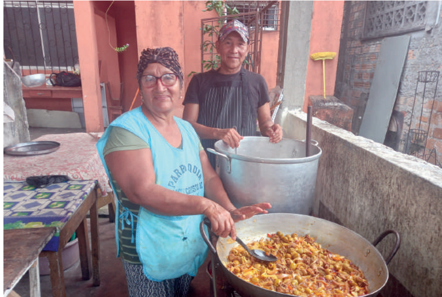
Comedor social Parroquia Sto. Cristo de Bagazán, Iquitos

S olidaridad es compartir, apoyar, ayudar, dar o darse sin esperar nada a cambio. Significa sentir las necesidades de los demás como propias y arrimar el hombro. Lo contrario del egoísta, que tiende a primar las cosas sobre las personas; la negación de la fraternidad. La solidaridad tiene como fundamento la justicia , que a su vez tiene como fruto la paz . Es un valor evangélico, por cierto, un aspecto nuclear del polifacético amar que nos dejara Jesús como único mandato. La solidaridad nos hace humanos, nos hace sentir que somos uno. Es tan importante que hasta la ONU la proclama como uno de los valores fundamentales para las buenas relaciones entre los pueblos. Es solidario quien denuncia un abuso, quien dona, recoge o distribuye alimentos, ropa o medicinas a los necesitados; el que detiene un desahucio, defiende un bosque, dona sangre o lleva alegría a los hospitales... la lista sería interminable. La solidaridad se puede ejercer con los de cerca y con los de lejos. Con los tuyos, o con aquellos que viven las cien caras de la pobreza rampante aquí o allá. Miren si no, a los misioneros, los voluntarios o los médicos sin fronteras . Al día de hoy, unos 1.200 millones de hermanos nuestros sobreviven con poco más de un euro al día. Son datos reales. Agustín nos advierte audaz: miren que “las cosas superfluas de los ricos son las necesidades de los pobres. Se poseen bienes