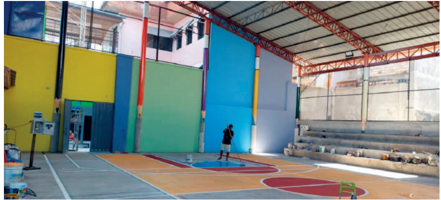
Instalaciones del Albergue El Huambrillo, Iquitos, Perú

A lo largo de este tiempo se han podido afrontar infinidad de proyectos: más de 50 de sensibilización, en torno a 250 de desarrollo (en diversos ámbitos: educación, sanidad, pastoral, capacitación, infraestructuras...) y 45 proyectos de apadrinamiento y promoción de la infancia. En todos ellos se ha puesto siempre en el centro a las personas, tanto las desti-