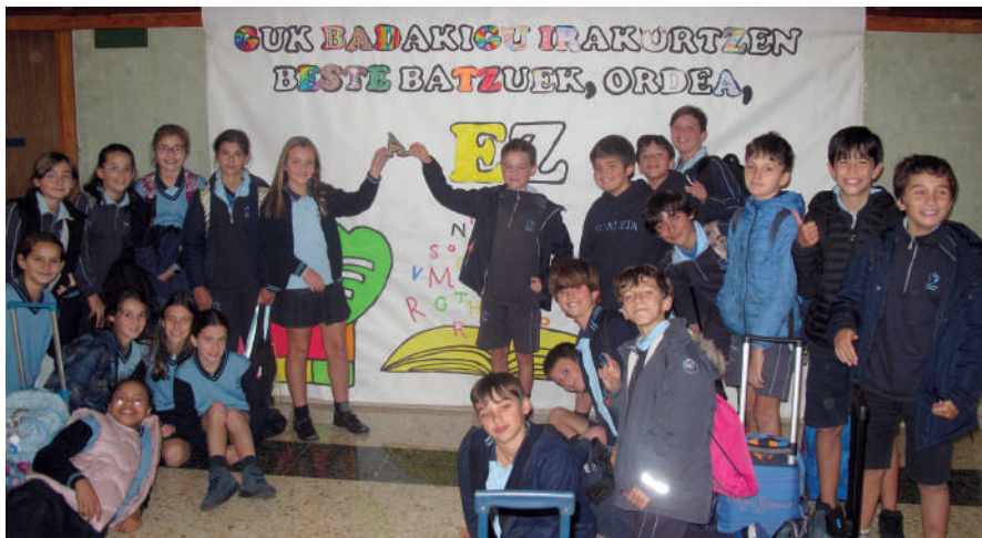
Niños voluntarios del Colegio A. de Urdaneta, Bilbao