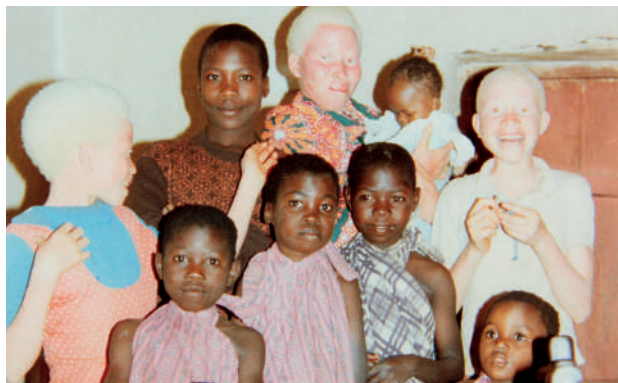
Niños de la casa Betania en 1983

cía cursos preparatorios en los que se seleccionaba y preparaba jóvenes (venidos desde diferentes partes del país) para estudios superiores. Se les enviaba luego como Aspirantes Agustinos a diversos centros católicos de enseñanza media o profesional, volviendo a Mahanje parte de sus vacaciones para cuidar su formación agustiniana. Tras conseguir el título profesional o bachillerato ingresaban en el noviciado. De hecho, en julio de 1987 emitieron la profesión los primeros agustinos tanzanos.